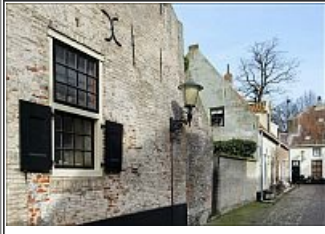
Foto-excursie: Naar het historische vestingstadje Elburg op zaterdag 20 mei 2017 met platform DigiFoto en HCC-Apeldoorn.