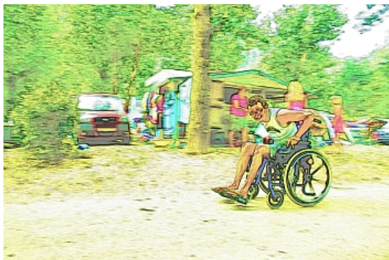
Derde prijs in de DigiFotowedstrijd 2009

Van Henk Rieke zijn we gewend aan zijn handleidingen die je helpen om met PSP versie 9 leuke dingen te doen. Deze keer maken we van een kleurenfoto een tekening in kleur.