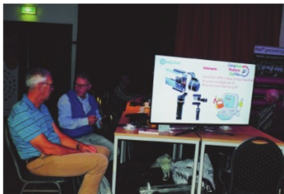
Er is altijd wel gelegenheid om iemand om advies te vragen

Zoals altijd zal het platform DigiVideo (videobewerkingsgroep) ook op de CompUfair van 8 februari in De Bilt acte de présence geven. Bezoekers kunnen ons vragen stellen over de diverse videobewerkingsprogramma's, zoals Power Director van Cyberlink, Magix Videodeluxe, Pinnacle, Lightworks en VirtualDub. En zeer waarschijnlijk kunnen zij met een werkbaar advies huiswaarts gaan.