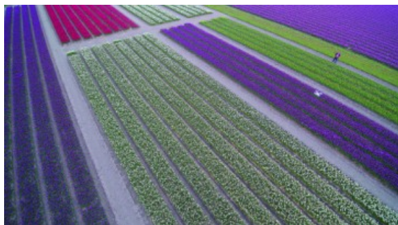
Opname van een bollenveld in de Noordoostpolder; hier geldt geen vliegverbod voor drones, vandaar ook de witte drone boven het veld

Presentatie: een goede videofilm van drone-opnamen maken.