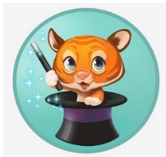
Gmicky, de G'MIC mascotte