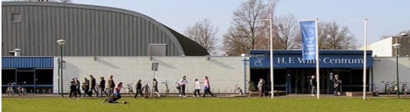
Cultuur- & Vergadercentrum H.F. Witte

Op 8 februari 2020 organiseren wij onze winter-CompUfair in: