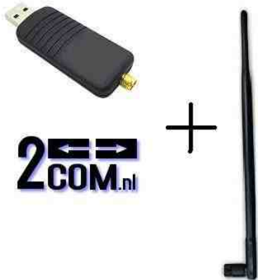
De Wi-Fi Range Extender van 2Com

Aan signaalsterkte, signaalkwaliteit en ontvangstgevoeligheid van het AP kun je weinig doen. Bij een (te) zwak signaal kun je proberen er fysiek dichterbij te komen (= sterker signaal). Vaak blijkt de in je laptop ingebouwde WLAN-adapter een zwakke plek. De meeste laptops zijn voorzien van een ingebouwde WLAN-adapter meteen weinig gevoelige antenne. Maar er zijn nogal grote verschillen tussen laptops, waar het gaat om hun kwaliteiten om verbinding te maken met AP's.