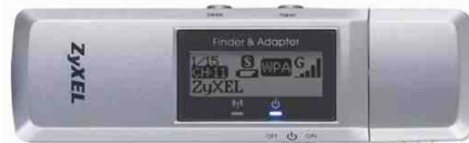
De ZyXEL_AG-225H (Wi-Fi Finder)

Ook met een losse Wi-Fi-finder of een voor WLAN-gebruik geschikte telefoon kun je draadloze netwerken detecteren, zonder opvallend met een laptop rond te zeulen.