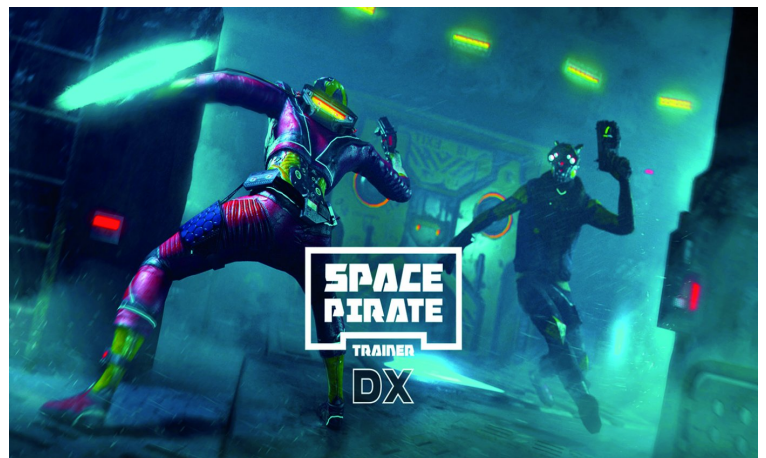
Afbeelding 3: Space Pirate

Met een beetje oefening lukt Golf wel aardig, maar Space Pirate vind ik zelf toch leuker, een beetje drones vernietigen! Grappig is dan hoe goed de bril de exacte positie weet en hoe de bewegingen van de bril in de spellen overeenkomen. Dit maakt het realisme een stuk groter dan bij de brillen waar een telefoon in ging.