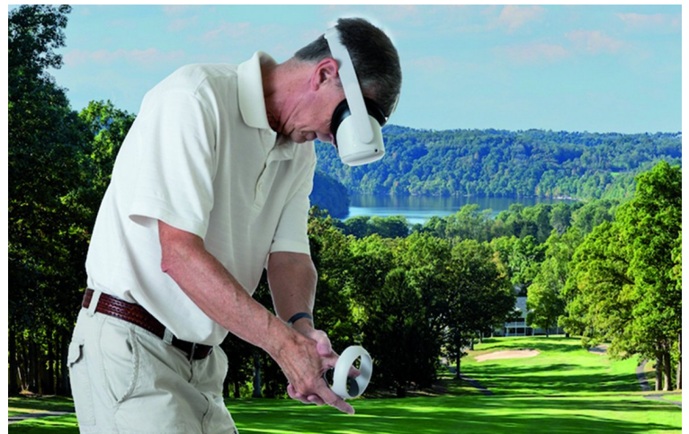
Afbeelding 2: Best-golf-vr-games-oculus

Standaard heb je ook twee gratis spellen na de registratie van de bril, te weten Space Pirate en Golf.