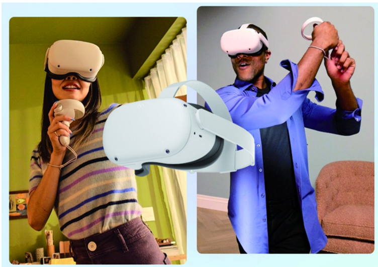
Afbeelding 5: Spelers in volle actie

Helaas waren er wat weinig bezoekers tijdens de Kennisdag, maar toch was het wel een aantrekkelijk object. Zelfs bij mensen die de bril niet op deden, om welke reden dan ook, gaf het wel een mooi aanknopingspunt om met bezoekers in gesprek te gaan over techniek, en ook dat is belangrijk bij onze vereniging.