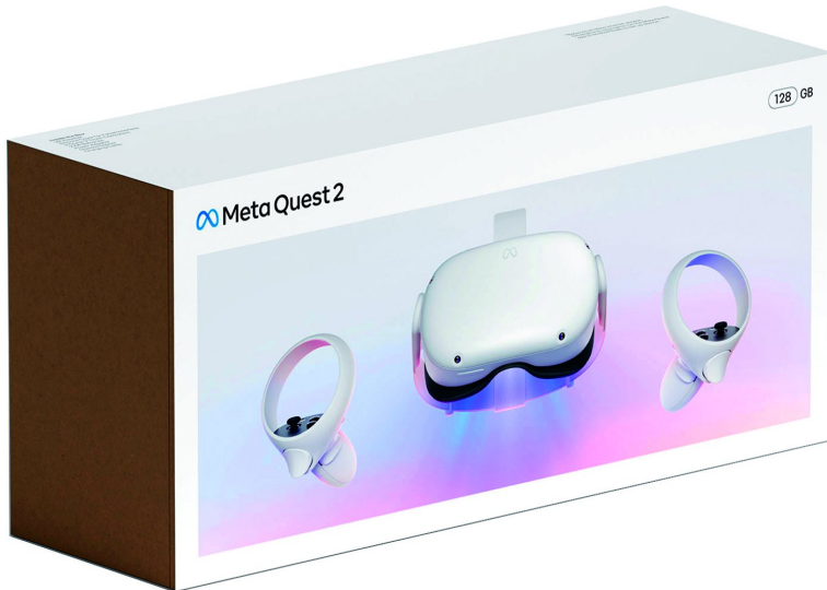
Afbeelding 1: Meta Quest 2

Zoals bekend: VR staat voor 'virtual reality', oftewel 'een mogelijke, door de mens bedachte werkelijkheid'.