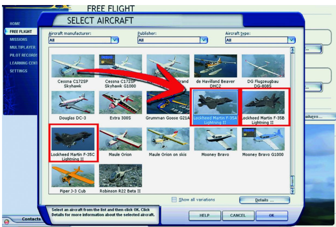
Scherm om een vliegtuig toe te voegen aan jouw versie van FS.

En toen was er, zo'n 20 jaar geleden, Flightsimulator . Het vliegen bleek redelijk aan te sluiten op mijn ervaringen met zweefvliegtuigen, en het gebruik van de motor wende ook snel, mede omdat alle motoren gezamenlijk bediend konden worden. Een moeilijk punt is het correct vliegen van bochten, omdat je altijd recht op je stoel blijft zitten.