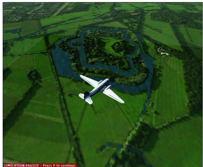
Vliegen over de Nieuwe Hollandse Waterlinie.

Bij demonstraties op de CompUfair start ik vaak van Soesterberg, vlieg over het H.F. Witte Centrum en daarna over forten van de Nieuwe Hollandse Waterlinie.