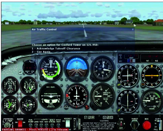
Het scherm Air Traffic Control

Nog langer geleden had ik de kans gekregen om het zweefvliegen te leren. Dat heb ik een paar jaar gedaan, maar toen bleek het meer tijd te kosten, dan ik beschikbaar had en dus moest ik er mee stoppen. De herinneringen bleven. De eerste solovlucht, het zoeken naar thermiek, zorgen dat je een goede landing maakte.