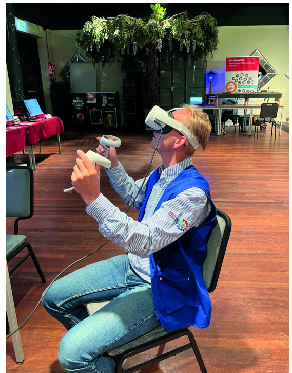
Het nieuwste op het gebied van VR-brillen werd gedemonstreerd

Linksboven: Iedereen staat in de startblokken om zijn of haar specifieke computer-hobby onder de aandacht te brengen